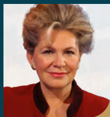
BOGYAY KATALIN a Magyar ENSZ Társaság elnöke